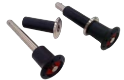
Sistema de anclaje desmontable (opcional)