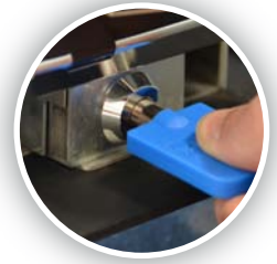
Bloqueos interiores de acceso al efectivo (opcionales)