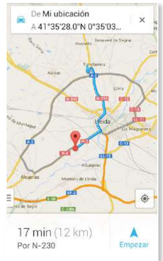
Localizan tu restaurante fácilmente