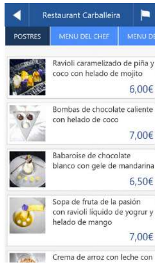
Consultan la carta y los platos