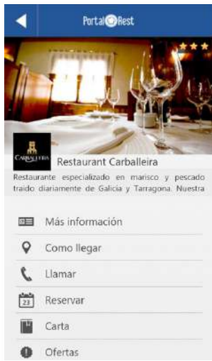
Visualizan tu restaurante