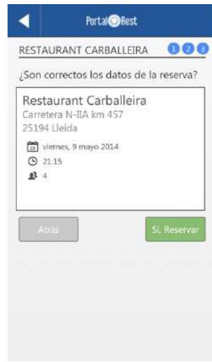
Realizan reservas on-line