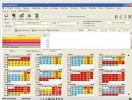
Pantalla de Tarifas del Hotel