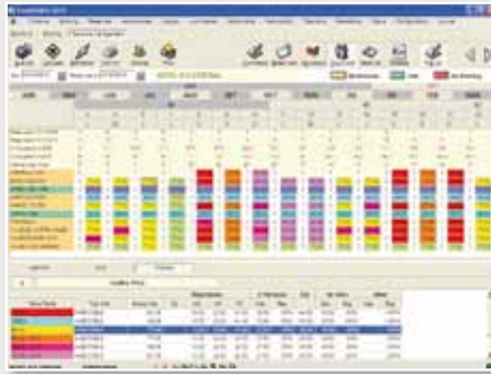
Pantalla de Revenue Management