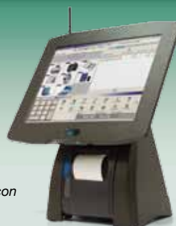
Terminal táctil ICG con impresora integrada