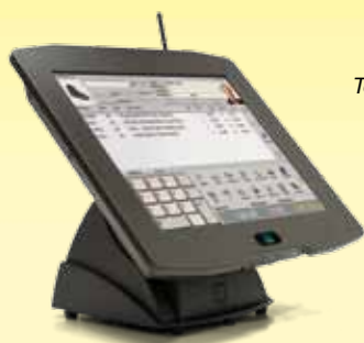
ISPOS Terminal táctil resistente al polvo y al agua (IP66)