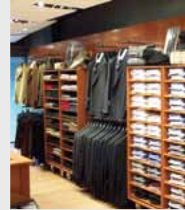
Boutiques, Zapaterías, Tiendas de deporte...