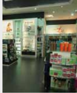
Perfumerías, Centros de estética...