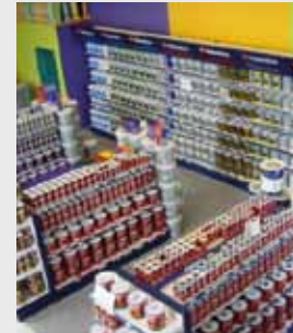
Ferreterías, Tiendas de pintura...