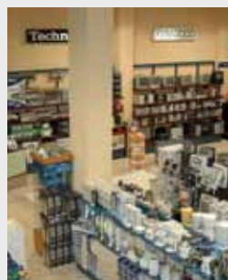
Tiendas de telefonía y electrodomésticos