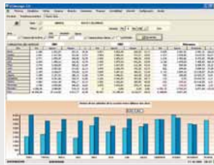
Rendimiento mensual por departamento y secciones