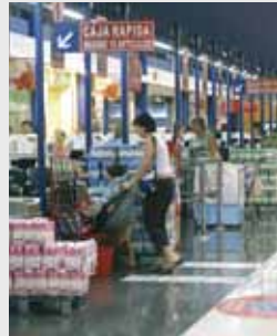
Supermercados, fruterías, carnicerías...