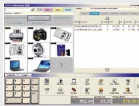
Pantallas de venta configurables